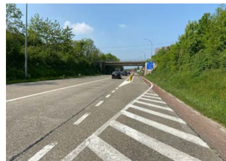
Afslag richting ingang N3 Haspengouwlaan