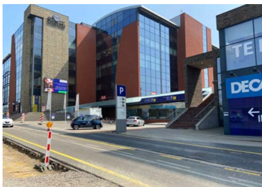
Ingang N3 Tienessesteenweg