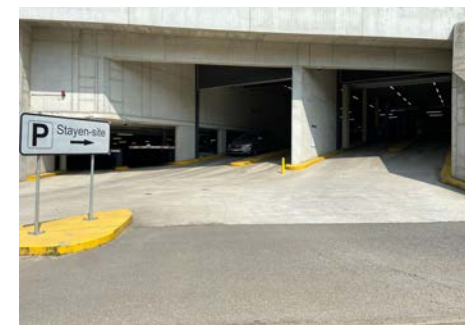
Ingang N3 Haspengouwlaan